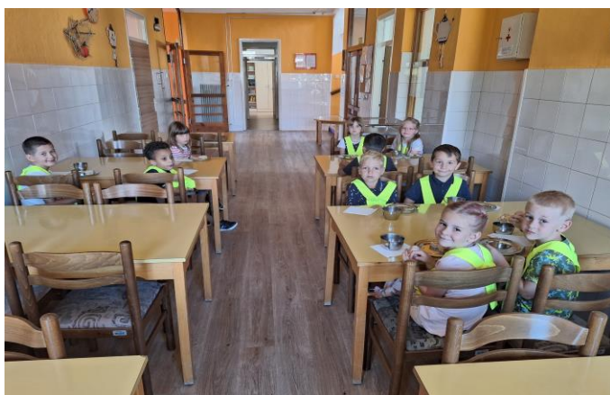
pojedli prvo šolsko malico