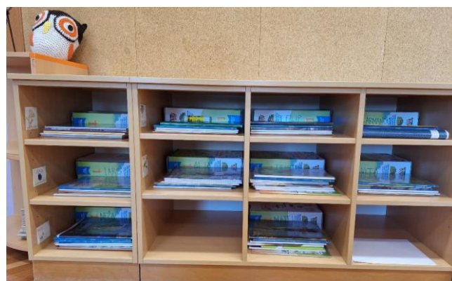
pospravili nove šolske potrebščine v predalčke