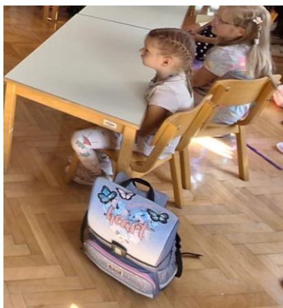
prinesli šolsko torbico

A pravi prvošolec postaneš, ko neseš torbico, ko dobiš rumeno rutico za varnost v prometu, ko znaš pospraviti šolske potrebščine, ko si sam naslikaš znak za garderobo in poješ prvo šolsko malico. Vse to so naši prvošolčki storili.