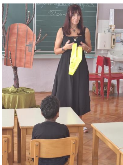
dobili rumeno rutico