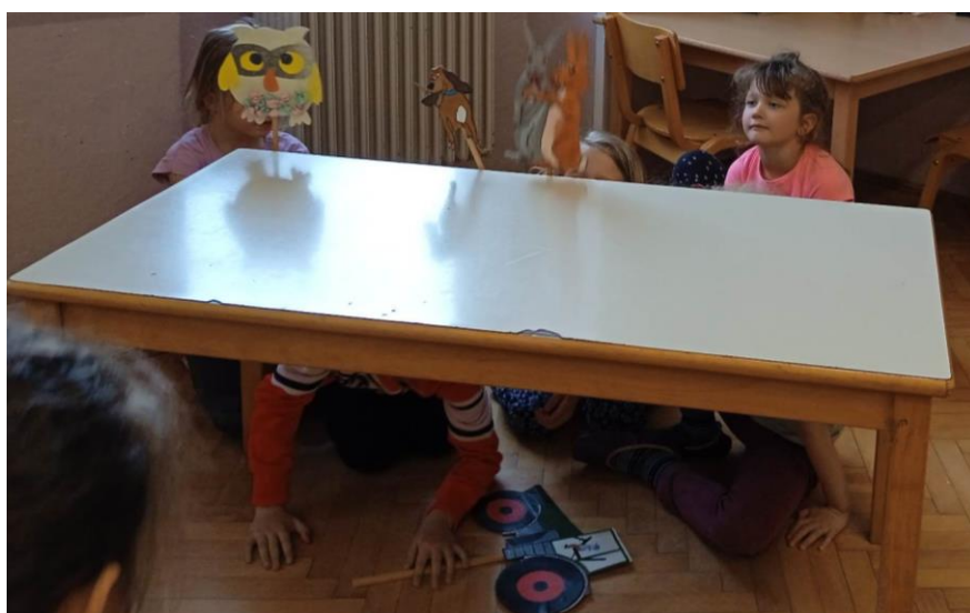
Zapisala: učiteljica Petra Mauko