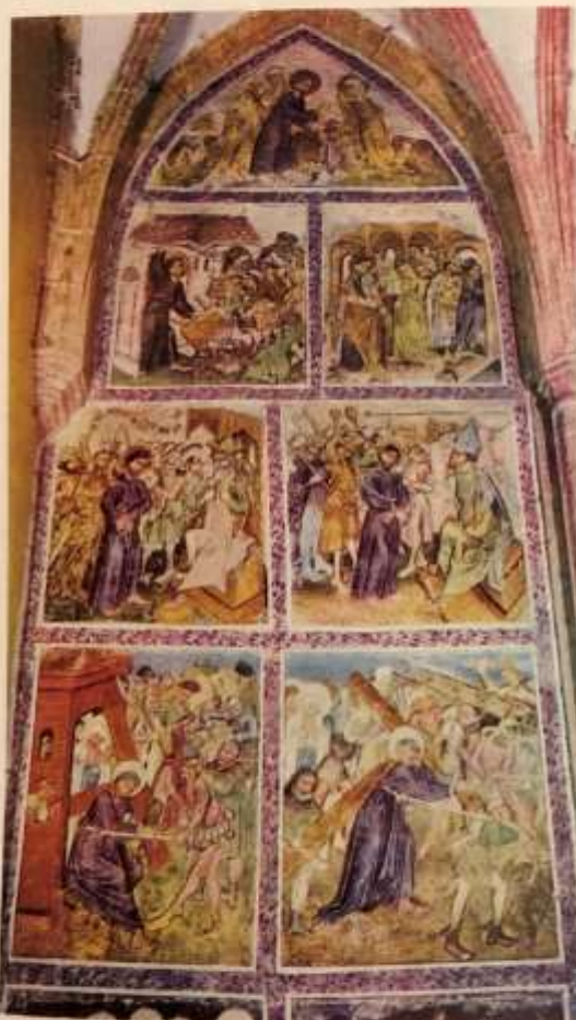
Pasijonska podoba v cerkvi sv. Duha v Slovenj Gradcu, 1450–1460

V srednjem veku je nastal "strip" v 14 slikah – Kristusov križev pot in pasijon.