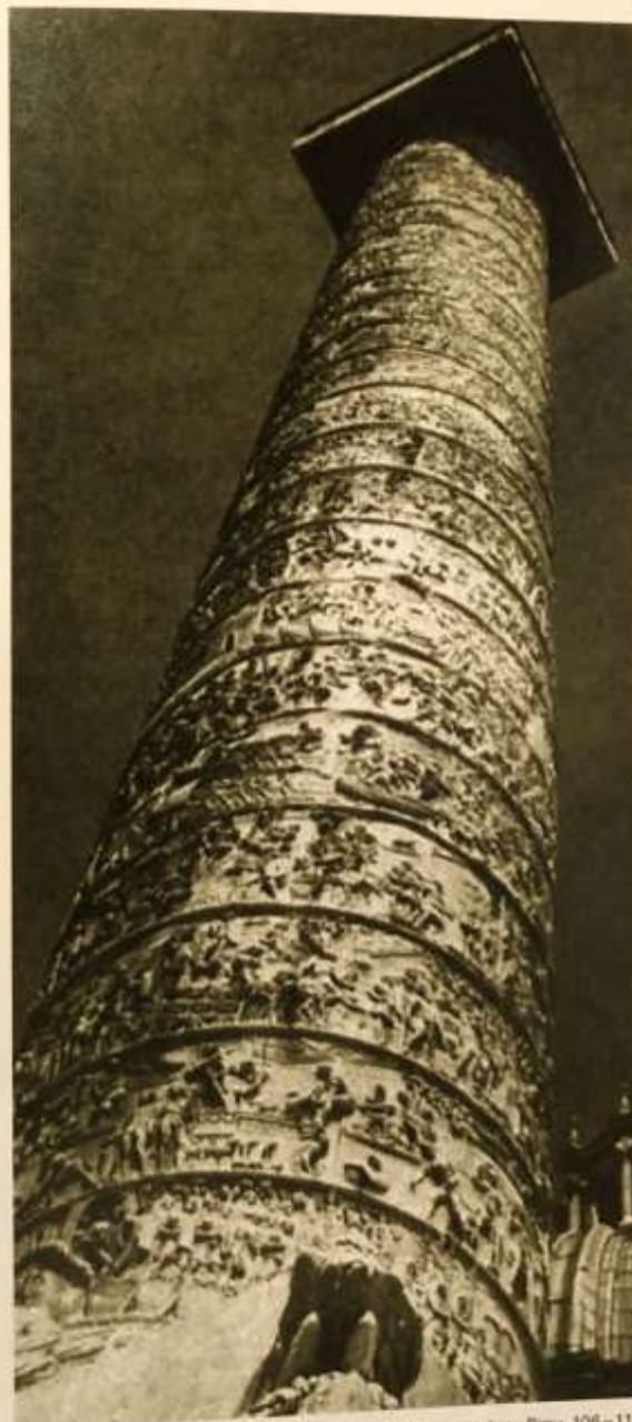
Trajanov steber v Rimu, 106–113

Glede na tematiko poznamo danes več vrst stripov: