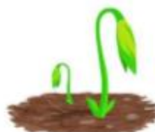
Plants Poking Through The Soil