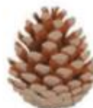
A Pine Cone