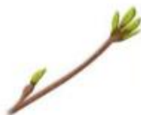
Buds On A Tree